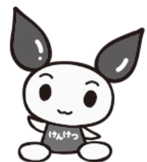
献血キャラクター:けんけつちゃん